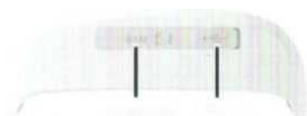
Слот SIM-карты Разъем питания от USB

Снимите резиновую крышку сбоку устройства, вставьте sim-карту в слот для sim-карты, если вы приобрели MICRO-SIM, вставьте ее в переходник для Micro-SIM следующим образом: